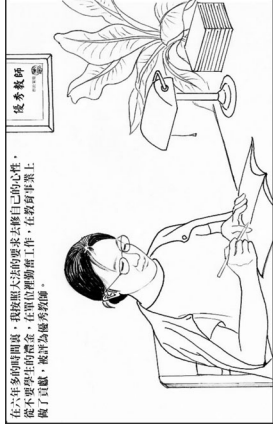
在六年的修炼期后，我彻底忘掉了的烦恼是去耕田的心性，能不要学生的概念，在单位做教研工作，在教新课堂上，除了认真，还称为优秀教师。